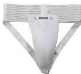
4. Защита на пах.