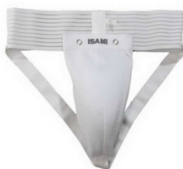
4. Защита на пах.