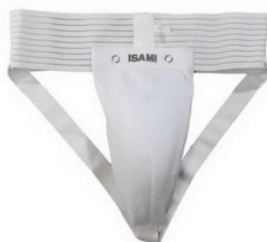
4. Защита на пах.